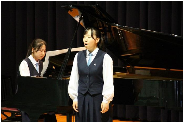
<ソプラノ独唱> ティリンデッリ作曲：春よ