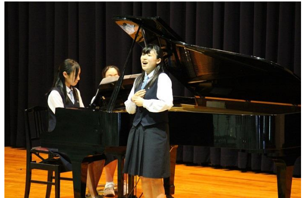
<ソプラノ独唱> アルディーティ作曲：ロづけ