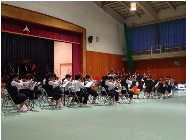
<弦楽合奏> 木村 弓作曲：いつも何度でも アンダーソン作曲：プリンク・プランク・プルンク