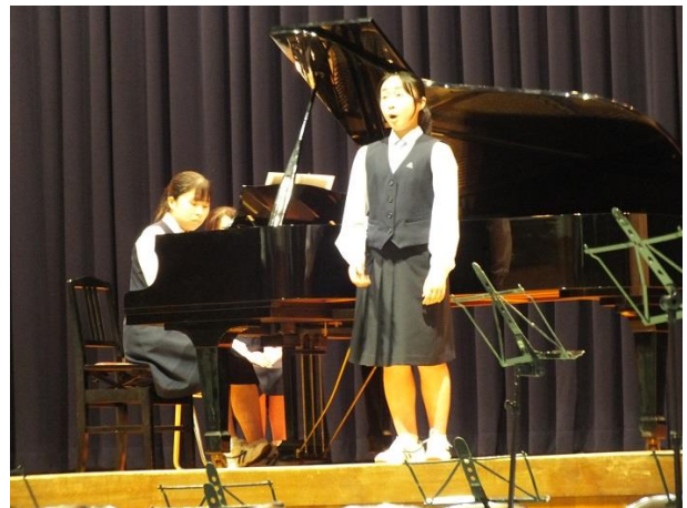
<ソプラノ独唱> フンパーディンク作曲：オペラ「ヘンゼルとグレーテル」より 「さあ、ホップホップホップ」