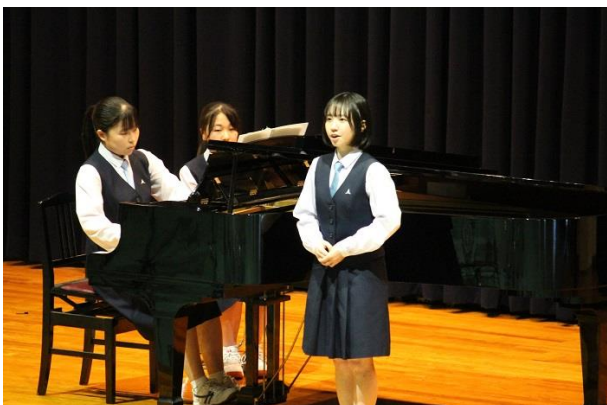
<ソプラノ独唱> フンパーディンク作曲：オペラ「ヘンゼルとグレーテル」より 「私は露の精」