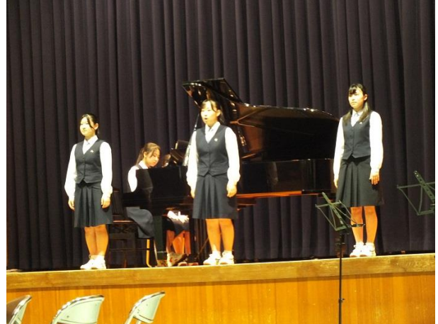
<ソプラノ独唱> フンパーディンク作曲：オペラ「ヘンゼルとグレーテル」より 「なんて悪い子どもたちなんだい」